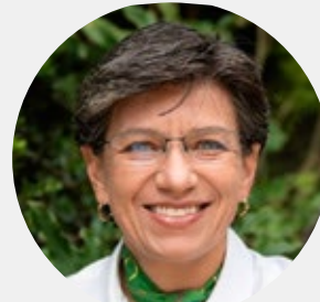
Claudia López Hernández Alcaldesa Mayor del Distrito Capital de Bogotá

El liderazgo de Buenos Aires y Bogotá, en el marco de su vicepresidencia del comité directivo de C40, redundará en comprometer a cada vez más ciudades de América Latina a la acción climática efectiva, para avanzar conjuntamente hacia una nueva normalidad ambientalmente más responsable.